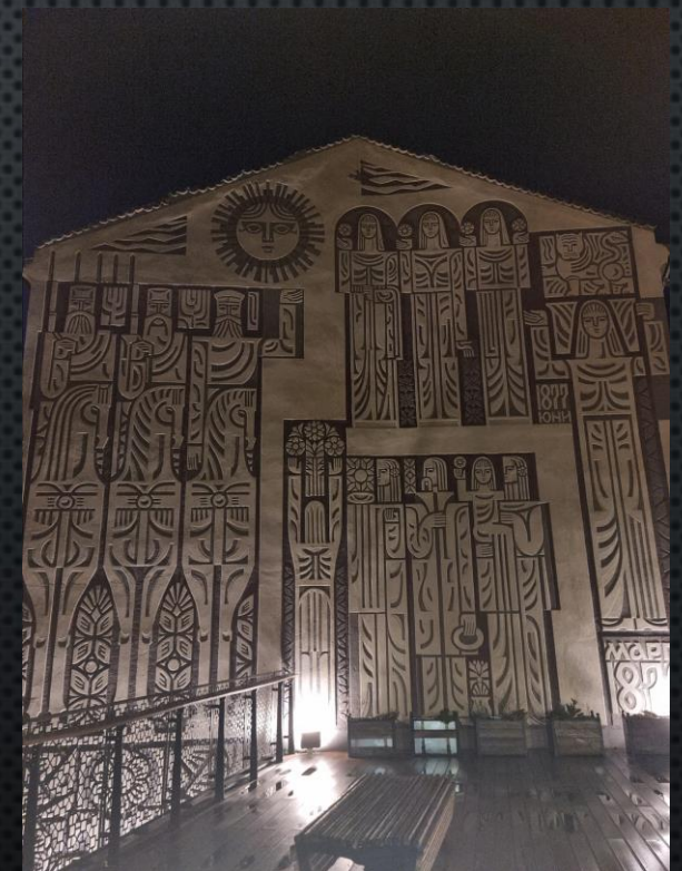
Fata unei cladiri Veliko Tarnovo